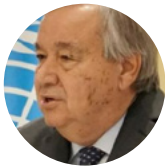
Antonio Guterres , secretario general de las Naciones Unidas

... Tendremos el placer de escuchar a responsables de la ONU y representantes gubernamentales: