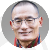
Tshering Tobgay , primer ministro de Bután